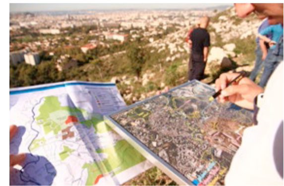
1- Plan Local d'Urbanisme 2- Plan d'Occupation des Sols 3- Schéma de Cohérence Territoriale 4- Marseille Provence Métropole 5- Pays d'Aubagne et de l'Etoile 6- Bus à Haut Niveau de Service

On le voit donc des paysages emblématiques parfois, qui se transforment, des paysages qui vivent avec des projets associés à des échelles territoriales multiples, du quartier à l'impact d'un objet monde d'échelle métropolitaine : le Parc national des Calanques.