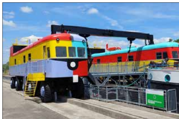
Machinerie de transfert des péniches sur la pente d'eau de Montech

communauté de communes du Grand Sud Tarn et Garonne, a permis au concepteur ALEP de mettre en valeur cet ouvrage désaffecté qui servait au transit des péniches sur le canal latéral à la Garonne.