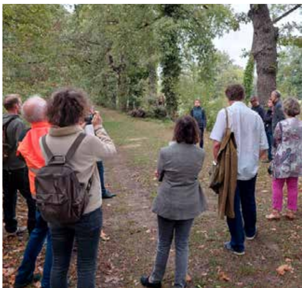
VNF expose sa politique sur les alignements le long du canal de Midi, sur site, à Gardouch (Haute-Garonne)

L'association Allées-Avenues organisait avec le conseil départemental de la Haute-Garonne les premières rencontres autour des allées d'arbres, avec l'objectif de partager les bonnes pratiques de gestion des arbres d'alignement.