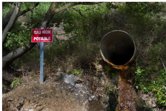
Résurgence faisant l'objet d'une surveillance de la teneur en arsenic