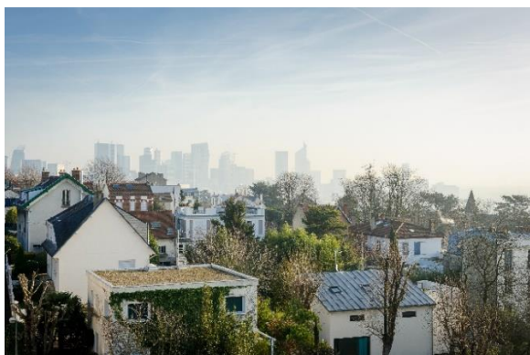
Pollution atmosphérique en Ile-de-France

Ce thème s'inscrit dans le cadre des travaux du Conseil de l'Europe pour la mise en œuvre de la Convention sur le Paysage, pour l'année 2023. L'ensemble des Parties à la Convention sont invités à porter des expériences, à restituer des enseignements qui seront autant de matériau pour la formulation d'une recommandation en comité des ministres du Conseil de l'Europe. Ce recueil regroupe les expériences et connaissances de nos partenaires à ce jour sur le thème Paysages et santé.