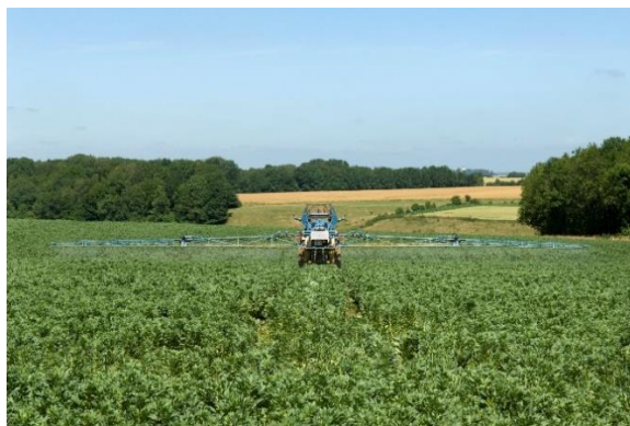
Traitement des cultures