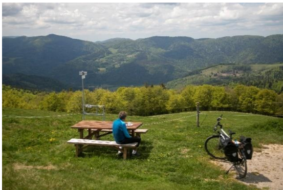
Cyclotourisme dans le Haut-Rhin