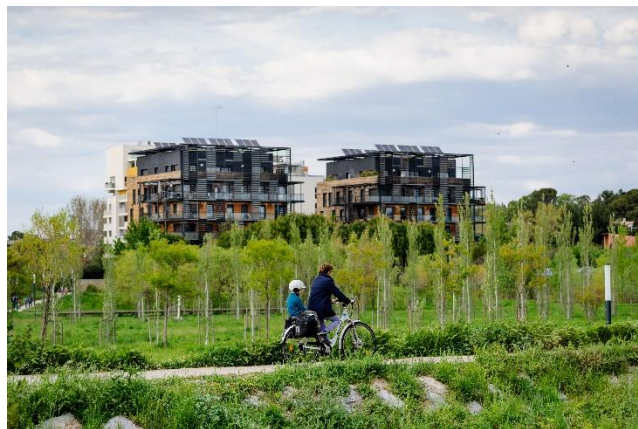
Écoquartier Parc Marianne à Montpellier

francoise.paquelot@paysages-apres-petrole.org