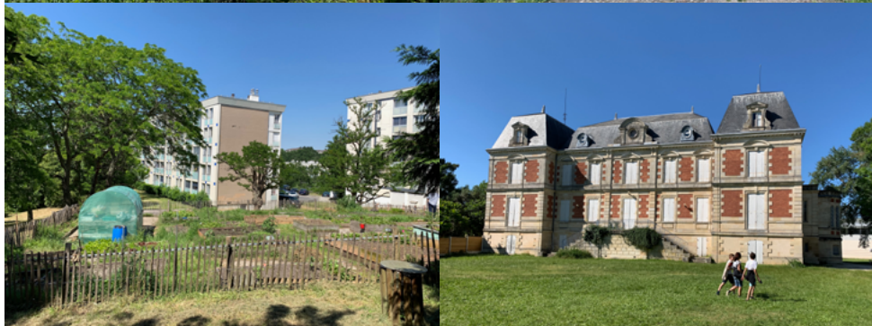
Parc de l'Ermitage, 2021, B. D. Jardins à Cenon, 2020, B. D.