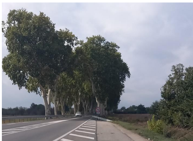
La route nationale avec ses platanes et les aménagements de sécurité (glissières et réduction de vitesse)

Route nationale 113 : 2 km, 235 platanes