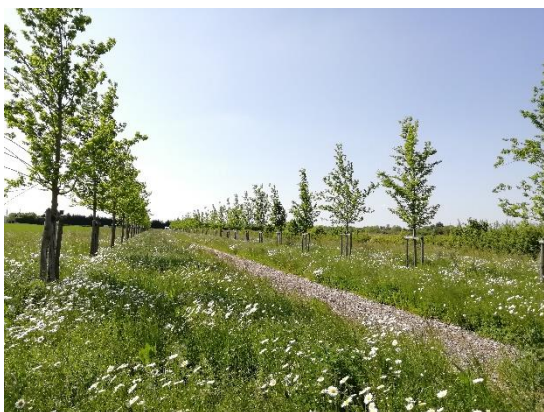
La jeune plantation, déjà bien présente dans le paysage

La communauté d'agglomération Versailles-Grand Parc met en œuvre la restitution de l'ancienne allée royale de Villepreux, axe historique de la Plaine de Versailles, un site classé au patrimoine mondial de l'Unesco. Après une phase d'études et d'acquisition de terrains, les deux premières phases de plantation de cette double allée ont été réalisées entre 2020 et 2022 et près de trois cents arbres plantés. Un projet complexe par la recomposition foncière qu'il a impliquée dans ce paysage morcelé par l'histoire et l'urbanisation. Une réalisation exemplaire par la prise en compte des aspects historiques, des conditions de plantation, de la biodiversité. La démonstration du potentiel des allées pour unifier, structurer un territoire et contenir l'urbanisation.