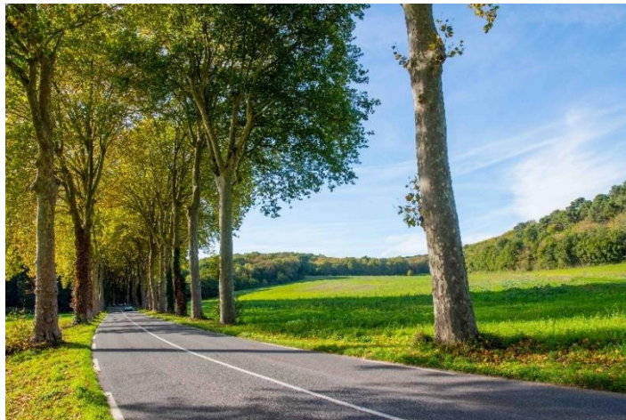
La « cathédrale » et ses fenêtres sur le paysage

Routes départementales et cours de collèges - 60 km d'allées et d'alignements