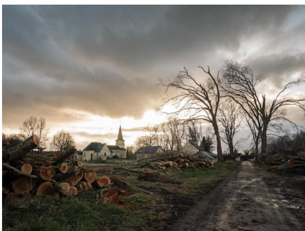
Photo de désolation en 2021 : les arbres encore debout sont eux aussi bien endommagés

Chemins privés - avenue de 230 m, platanes remplacés par 86 chênes chevelus – Allées du fer à cheval, 2 x 100 m, replantées en tilleuls