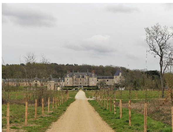
Nouvelle plantation

Les allées du château de Gizeux ont été dévastées en 2021 par une tornade d'une extrême violence, qui a mis à terre, brisé ou fragilisé quelque 350 arbres du parc, en particulier la grande allée de platanes bicentenaires. Après ce désastre, les allées ont été rapidement déblayées et sécurisées. Il a fallu ensuite définir une stratégie de replantation et mobiliser des financements. Les replantations ont pu être réalisées fin 2022. Le soutien de la population locale pour le déblayage et le financement de la replantation a montré une fois encore que les allées et leur devenir touchent la communauté au-delà des propriétaires.